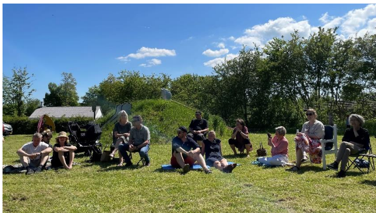
Foto fra generalforsamlingen 2021 på legepladsen.