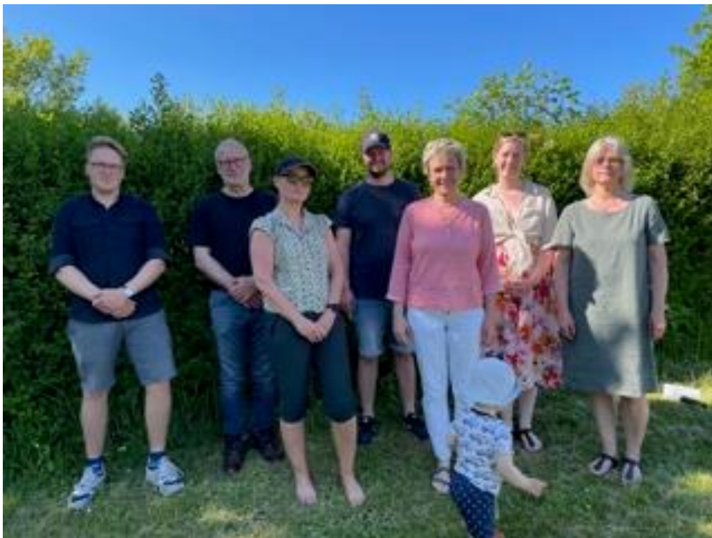
Bestyrelsen valgt på Generalforsamling 30.maj 2021