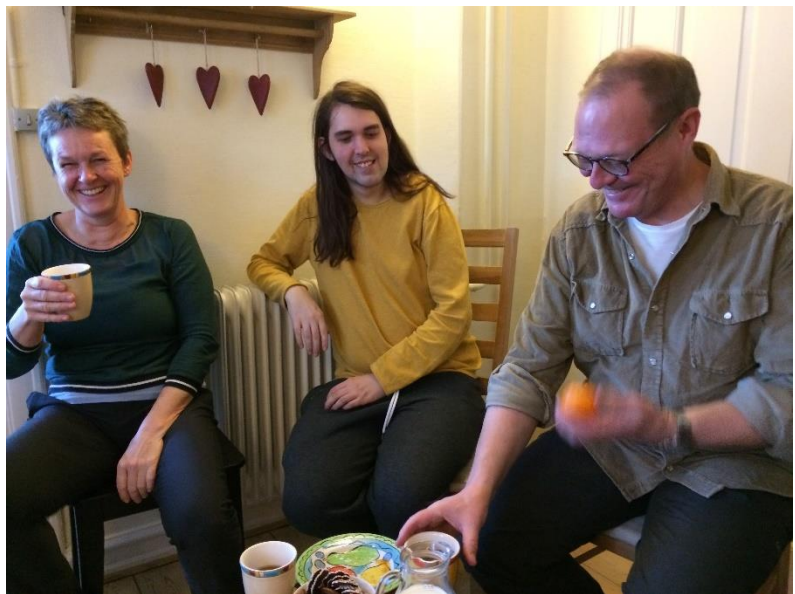
Billederne er fra tidligere arrangementer.