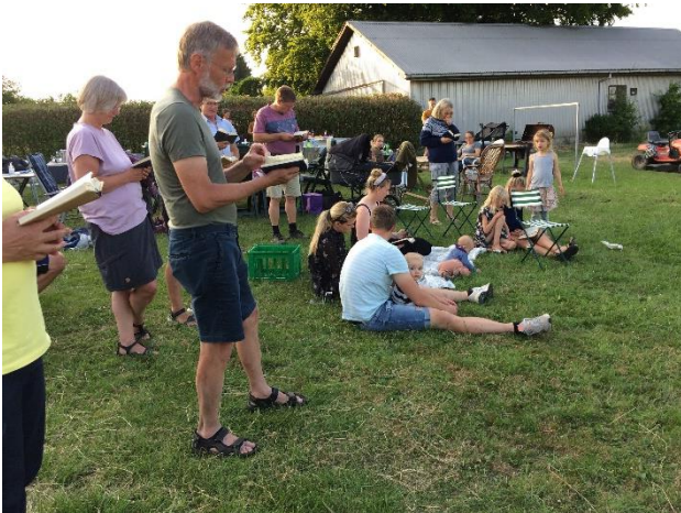
Foto fra Sct Hans 2020

Der er ikke datoer på arrangementerne, de bliver meldt ud i god tid, når arrangementet nærmer sig. Hold øje med vores hjemmeside www.lørup.dk , din mail, Facebook eller opslagstavlen på legepladsen.