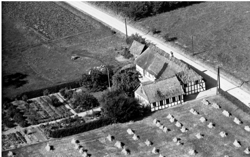
Mølledamsvej 3, Kastrup 1953