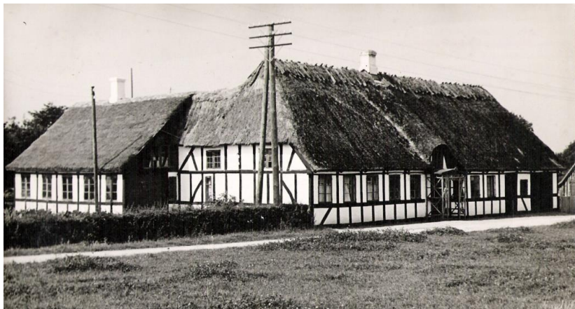
Mølledamsvej 3, Foto fra omk. 1950